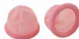
Größe M Nr. 01-90270M