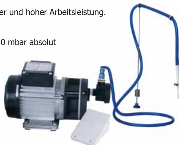
VP 3 - Set Nr. 04-66000

Lieferumfang: Vakuumpumpe VP3, Federstativ Vakuumhandstück mit Nylonbürste 3 m PVC-Schlauch, Fußschalter