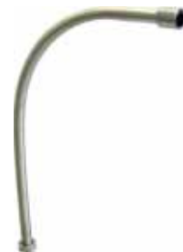
Schlauch-Führungsrohr Edelstahl – zum Einbohren Nr. 04-82002