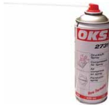
Druckluft-Dose 400 ml Nr. 20-15975